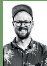
Fritz Zehetner Öl-Manufaktur