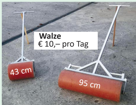
Walze € 10,- pro Tag