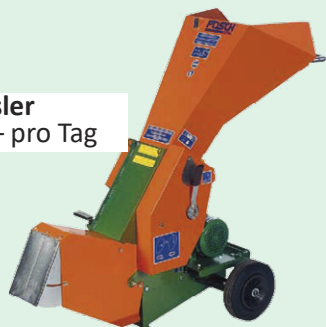
Häcksler € 15,- pro Tag