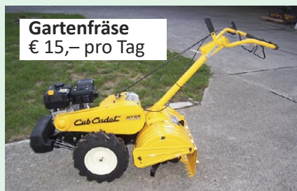
Gartenfräse € 15,- pro Tag