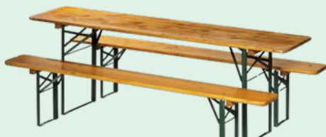
Biertischgarnituren (bis zu 15 Stück) pro Garnitur € 5,- pro Tag