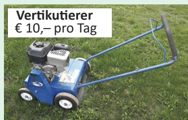
Vertikutierer € 10,- pro Tag